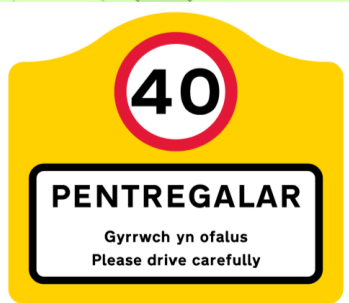
Proposed Settlement sign upgrade & Speed limit lowered to 40mph