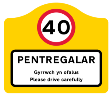
Proposed Settlement sign upgrade & Speed limit lowered to 40mph.