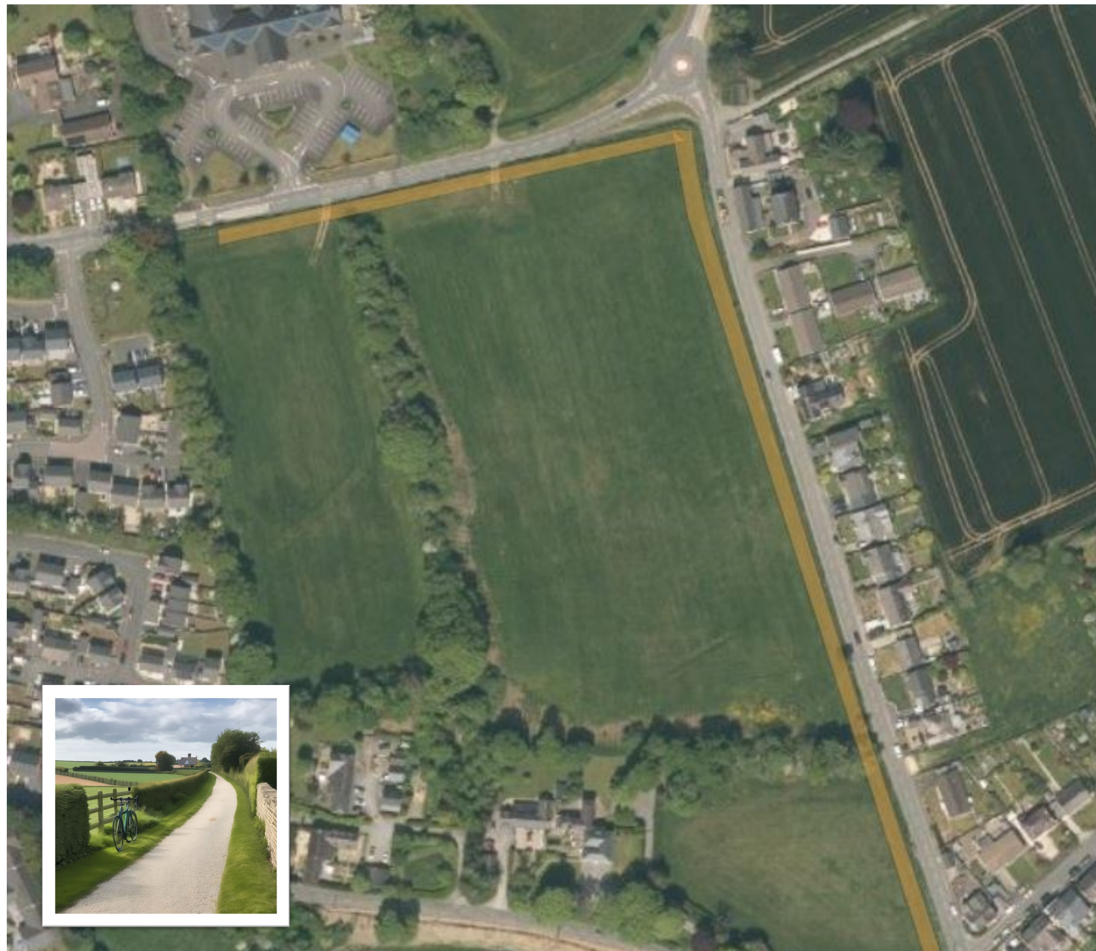
Kiln Road Llwybr SUP Posibl