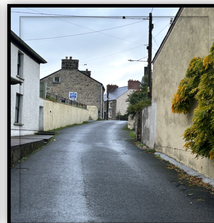
Rhan o lwybr yr aber