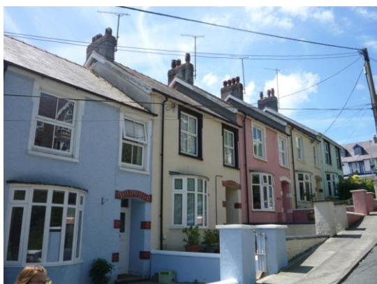
Glenside a Slade Cottages (04.06.2015)

4.4.8 Ymhellach i lawr y Slade mae 'Glenside' a adeiladwyd tua 1900. Fe'i moderneidiwyd ac erbyn hyn mae wedi colli'r holl nodweddion gwreiddiol. Mae rhifau 1 a 2 Slade Cottages o ddechrau'r 19eg ganrif, ac maent wedi colli'u manylion ffenestri gwreiddiol, ond ar wahân i hyn maent wedi cadw'u graddfa wreiddiol a'u lleoliad hanesyddol wrth droed llwybr coediog, serth, sy'n cysylltu, i fyny ochr y bryn, â chanol y dref ger y gofeb ryfel.