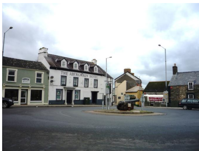
Sgwâr Abergwaun (2015)

4.4.15 Y Sgwâr yw calon hanesyddol y dref ac yno oedd y farchnad yn y canoloesoedd, ond erbyn hyn mae'r Sgwâr yn bwynt cyfarfod ar gyfer traffig sy'n mynd i dri chyfeiriad, gydag amrywiaeth o adeiladau o boptu'r ffyrdd hyn.