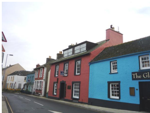
Eiddo amrywiol (eilrifau) ar Main Street (23.11.2015)

4.4.22 Ar Main Street mae amrywiaeth o adeiladau Sioraidd syml dau a thri llawr, cymesur, sydd i gyd i'w gweld ar fap hanesyddol 1843. Does yr un dau ffasâd fel ei gilydd, ond mae ganddynt fanylion sy'n gyffredin, megis: