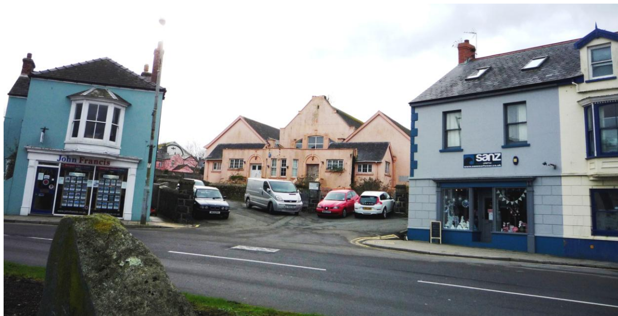
Rhifau 15 a 17 Y Wesh, a'r hen ysgol, o'r Wesh (23.11.15)

4.4.30 Adeiladwyd rhif 15 ganol y 19eg ganrif, ac mae'n eiddo preswyl sengl, cymesur gyda blaengwrt amgaeedig i'r chwith, a blaen siop Edwardaidd syml a chymesur gyda manylion da.