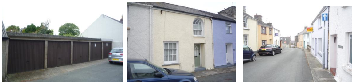
Eiddo Kensington Street a modurdai (4.6.15)

4.4.50 Wrth droi i'r chwith o Park Street i mewn i Kensington Street mae rhes o fodurdai heb unrhyw rinwedd gweledol, ond yna mae rhes o dai o ddechrau'r 19eg ganrif sydd i gyd yn agor i'r stryd. Mae yma amrywiaeth o fythynnod deulawr tlws gyda llinell grib di-dor, ffenestri codi fertigol, toeon llechi a simneiau brics, ac mae golygfa hyfryd o'r môr wrth i chi fynd i lawr y ffordd tuag at Main Street.