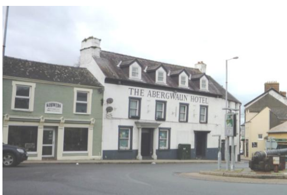
4.3.18 Mae Gwesty Abergwaun ar y Sgwâr yn adeilad deulawr gyda llawr eriad Ardal Gadwraeth 27

4.3.17 Mae rhif 32 Main Street yn dŷ teras pen o ddechrau'r 19eg ganrif gyda llawr gwaelod a addaswyd yn ystod yr 20fed ganrif. Mae'r to yn hongian dros rif 34 ac roedd y simnai chwith yn simnai i rif 34 yn wreiddiol. Wedi'i leoli gyferbyn â'r eglwys, mae'r Institiwt yn strwythur o ddechrau'r 20fed ganrif mewn arddull Celf a Chrefft syml. Mae gan yr eiddo ffryntiad bach ar y stryd, ond mae'n ymestyn yn ôl dros blot mawr.