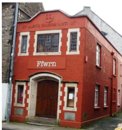
32 Main Street ac adeiladu Institiwt Eglwys y Santes Fair. (23.11.2015 )

4.3.17 Mae rhif 32 Main Street yn dŷ teras pen o ddechrau'r 19eg ganrif gyda llawr gwaelod a addaswyd yn ystod yr 20fed ganrif. Mae'r to yn hongian dros rif 34 ac roedd y simnai chwith yn simnai i rif 34 yn wreiddiol. Wedi'i leoli gyferbyn â'r eglwys, mae'r Institiwt yn strwythur o ddechrau'r 20fed ganrif mewn arddull Celf a Chrefft syml. Mae gan yr eiddo ffryntiad bach ar y stryd, ond mae'n ymestyn yn ôl dros blot mawr.