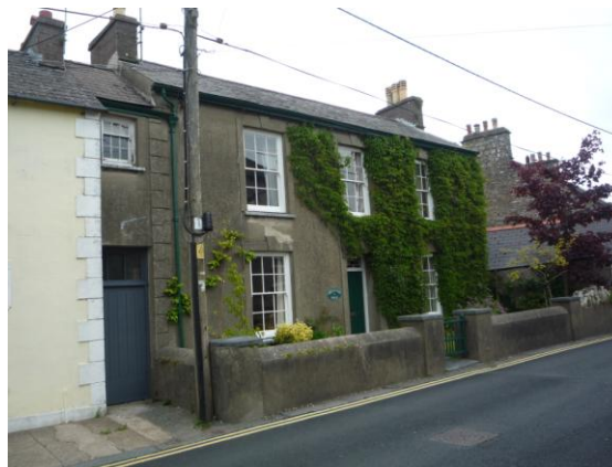
4 a 6 (Greenwood House) Park Street (4.6.15)

4.4.44 Mae tafarn o'r enw'r Cambrian ar gornel Hamilton Street, gydag eiddo arall yn ffinio arni ac yn rhedeg ar hyd Park Steet. Mae'r adeiladau ar fin y ffordd ac mae eu harddull yn syml, gyda llinell grib a bondo di-dor, teils crib coch, clai, corn simnai tal, to llechi, a ffenestri codi 2 baen traddodiadol.