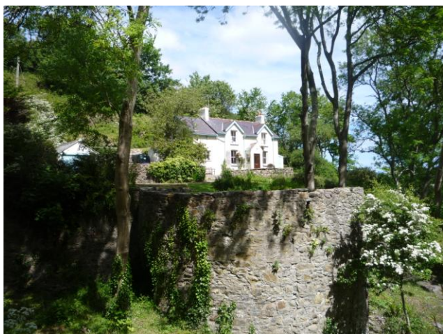
Carreg yr Eos (04.06.2015)

blaen sy'n tynnu sylw oddi wrth y tri bwthyn arall sydd wedi cadw'u cymeriad, graddfa a'u hudoliaeth gwreiddiol. Mae gan y rhain fanylion sy'n gyffredin megis y to llechi di-dor, simneiau bric, bandiau plastr wedi'u codi o amgylch agoriadau, a ffenestri fertigol.