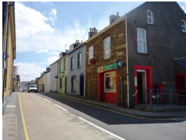
Eiddo preswyl a masnachol yn gymysg ar y Wesh (04.06.2015)

4.4.26 Mae llawer o dai wedi dioddef moderneiddio amhriodol yn ystod yr 20fed ganrif gyda llawer ohonynt wedi colli deunydd traddodiadol, ond maent yn dal i fod yn rhan o graidd hanesyddol y dref. Mae llawer o'r eiddo tri llawr rhwng 70 a 50 ar y Wesh wedi'u newid yn ddirfawr er mwyn creu gofod manwerthu ar y llawr gwaelod. Bu llawer o foderneiddio gan ddefnyddio Upvc, ond mae'r teras wedi cadw llawer o'r ffenestri bae ar y llawr cyntaf a'r ffenestri dormer goleddfol, ac felly'n dal i fod â hunaniaeth grŵp cryf.