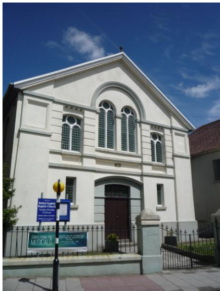
Gwesty Abergwaun a Bethel, Eglwys y Bedyddwyr Saesneg (23.11.2015)