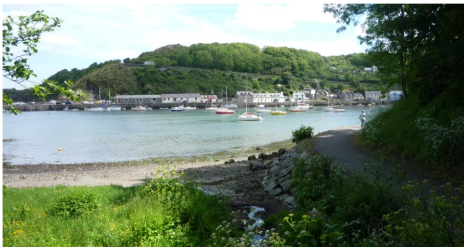
Golygfa o waelod y Slade tua Chwm Abergwaun (04.06.2015)

4.3.9 Fel y gwelir o ben deheuol y Stryd Fawr a Kensington Street, mae golygfeydd o'r môr i'w gweld o lawer o fannau o fewn yr Ardal Gadwraeth, ac mae llawer o gyfleoedd i gael cipolwg o'r môr ogystal â golygfeydd panoramig tuag at y môr a'r harbwr, rhwng adeiladau ac o fannau uchel. O ben y llethr caiff y llygad ei thynnu am i lawr gan y teras serth o fythynnod, ond mae yna hefyd olygfa bell wych tua'r dwyrain ar hyd yr arfordir tua Dinas a Threfdraeth. Ymhellach i lawr y llethr ar y llwybr i lawr y Slade, mae nifer o gyfleoedd i oedi ac edmygu golygfeydd o'r harbwr drwy'r coed ac, yn y manau agored, olygfeydd o'r arfordir a bryniau Dinas a Threfdraeth i'r gogledd.