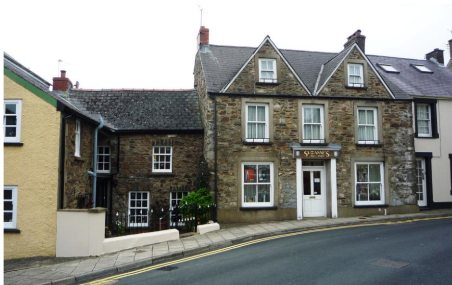
Cornel Main Street a Hamilton Street (05.06.2015)

4.4.52 Mae cyffordd Hamilton Street a Main Street yn gornel eang sydd â nifer o adeiladau diddorol ar wahanol onglau i'w gilydd. Mae rhif 2 yn cael ei gysgodi gan dalcen rhif 12 Main Street, gan bwysleisio'r gwahaniaeth ym maint yr adeiladau.