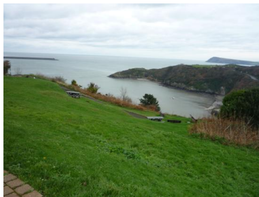
Y Golden Mile (04.06.15) a'r Slade (23.11.15)