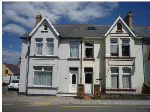
Eiddo Vergam Terrace (4.6.15)

4.4.37 Mae rhifau 1- 23 (odrifau) a rhifau 10-24 (eilrifau) Vergam Terrace yn ddwy res o dai tref deulawr a hanner sy'n dyddio o ddiwedd y 19eg a dechrau'r 20fed ganrif, gyda rhai manylion ardderchog sy'n cael eu hailadrodd megis to llechi didor gyda theils crib clai uniad bôn, toeon dormer mawr llechi yn ymestyn o'r ffasâd, simneiau tal addurniadol o frics, rhai estyll tywydd addurniadol, bandiau plastr addurniedig o amgylch agoriadau, manylion plastr addurniedig o gwmpas y ffenestri bae a nwyddau dŵr glaw haearn bwrw. Mae gan rifau 2 - 24 erddi blaen