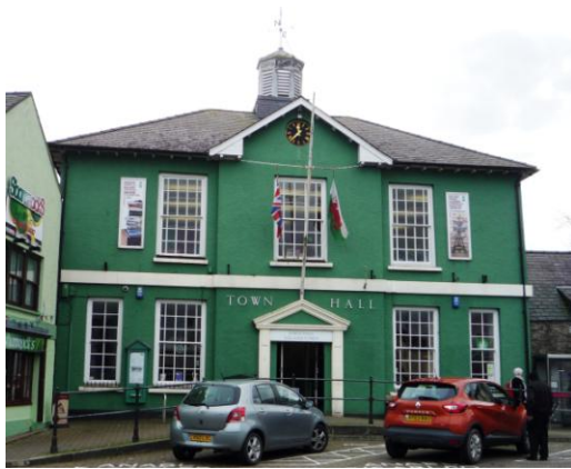
Neuadd y Dref Abergwaun (23.11.15) a'r Fishguard Arms (11.03.2008)