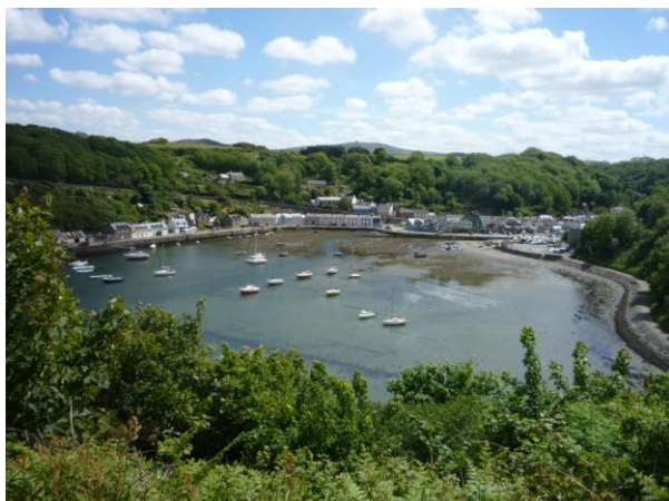
Golygfa o Gwm Abergwaun o'r Slade (04.06.2015)

4.3.10 O ardal ddiarffordd rhan uchaf y Slade mae golygfeydd hyfryd o'r harbwr, gyda golygfa bellach o fryniau Dinas a Threfdraeth.