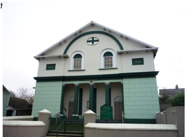
Waliau wedi'u gorchuddio â llechi yn rhif 64 y Wesh, a Chapel Hermon (23.11.15)