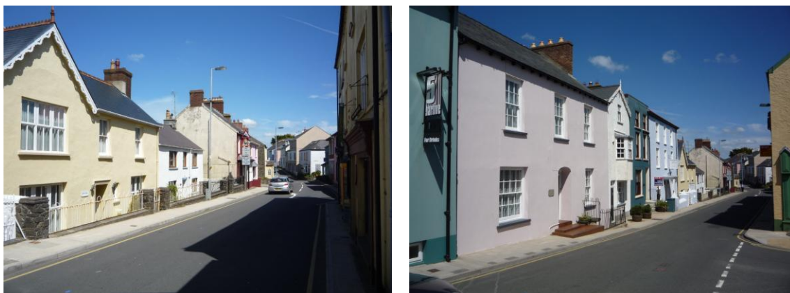
Ffryntiad Main Street (5.6.15) [Gwesty'r Manor House yn las golau]

4.4.55 Ar ochr ogleddol Main Street mae rhes o dai Sioraidd, rhai ohonynt o ansawdd dda, megis Gwesty'r Manor House gyda'i bortico cymesur.