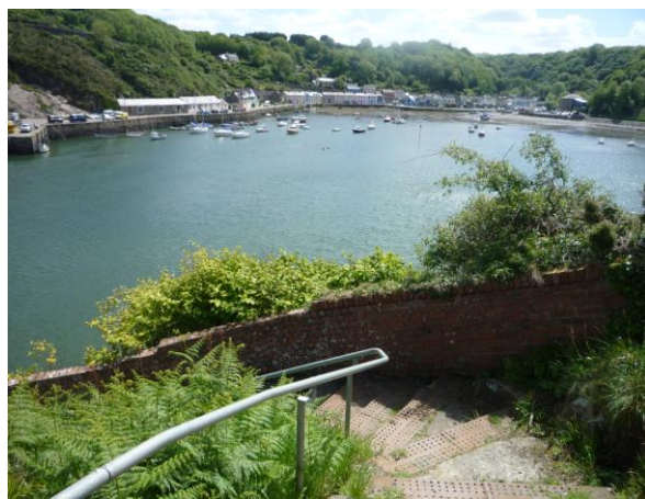
Golygfa o Gwm Abergwaun, i'r de o Saddle Point (2015/06/04)

4.3.9 Mae Tower Hill yn nwyrain Abergwaun yn arwain at lwybr troed sy'n dilyn ochr y dyffryn i'r de uwchben Chwareli Pistyll Hotch a Blaen-y-delyn, ac oddi yma ceir golygfeydd panoramig dros Gwm Abergwaun i gyffiniau Heol Glyn-y-Mel. O'r fan hon gellir gweld llethrau coediog, trwchus y dyffryn uwchben y tai a'r tu hwnt i hynny, fryniau Dinas a Threfdraeth.