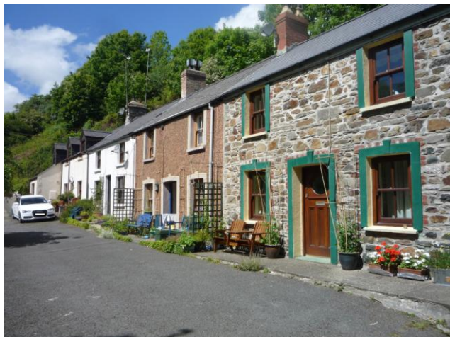
Bank Terrace (04.06.15)

4.4.9 Ymhellach ymlaen mae grŵp o bedwar bwthyn, y ddau isaf ohonynt i'w gweld ar fap hanesyddol 1843-1893. Maent yn amrywio o ran maint a graddfa ond mae ganddynt doeau gyda'r un goleddf, yn un gorffeniad rendr a ffenestri fertigol traddodiadol.