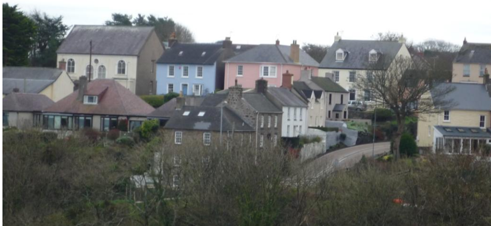
Hill Terrace a Tower Hill, o Penslade (23.11.2015 wedi'i chwyddo)

4.4.58 Mae Tower Hill yn rhedeg tua'r dwyrain o Main Street, o ben Hill Terrace, ac mae yno deras o saith o dai tref Sioraidd, a Chapel o'r 19eg ganrif, sydd i gyd ond un yn rhestredig Gradd 2. Mae eu safle uchel yn eu gwneud yn weladwy o Penslade ar draws cwm Slade ac o Hill Terrace.