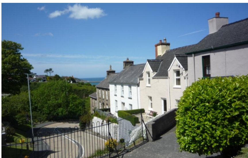
Golygfa o Hill Terrace, o Tower Hill (04.06.2015)

4.3.10 O ardal ddiarffordd rhan uchaf y Slade mae golygfeydd hyfryd o'r harbwr, gyda golygfa bellach o fryniau Dinas a Threfdraeth.