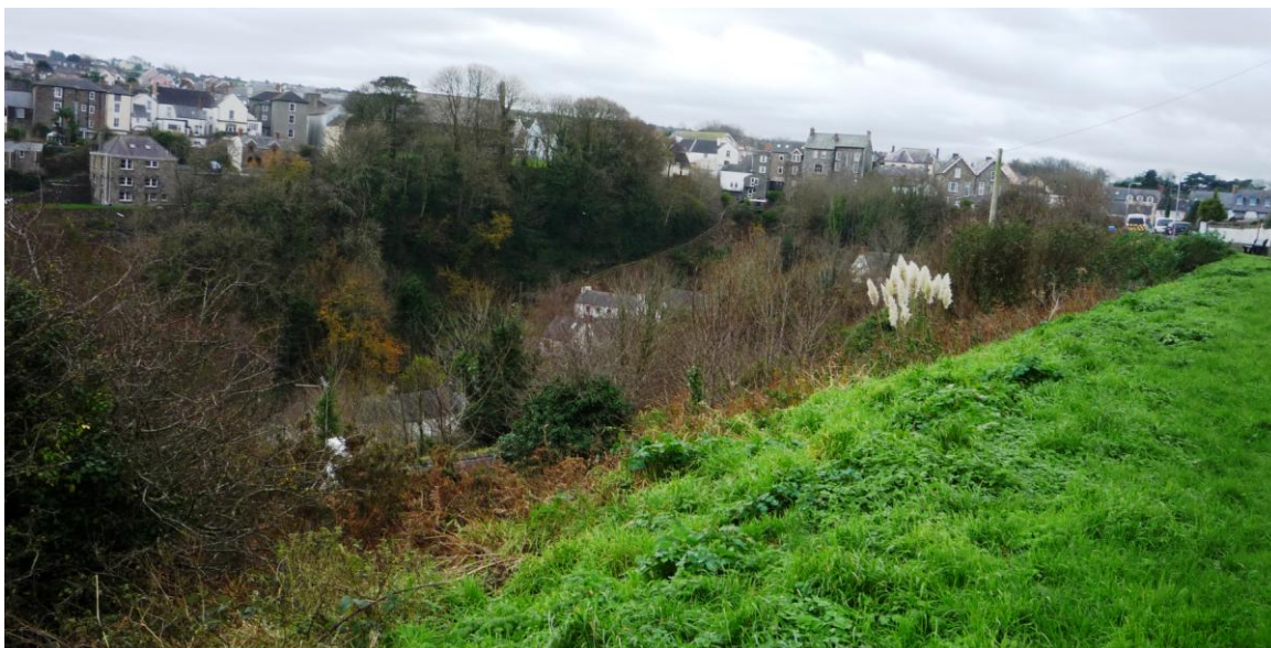
Dyffryn y Slade (23.11.2015)

4.4.4 Mae gan y dyffryn lethrau serth gydag ardaloedd coediog, a rhwydwaith o lwybrau ar wahanol lefelau sy'n cysylltu'r ardal â chanol y dref ger y Gofeb Ryfel, yr harbwr a phen gogleddol y Penrhyn.