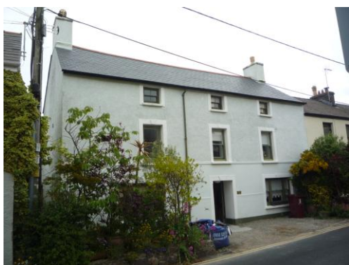
Walter Brearley House (06.04.2015)

4.4.45 Yna mae'r llinell adeiladu'n symud yn ôl tua 1500mm i ffryntiad rhifau 2, 3 a 4, sy'n fythynnod deulawr, rhestredig Gradd 2, a adeiladwyd o gerrig ddechrau'r 18fed ganrif ac sydd â'r rhan fwyaf o nodweddion traddodiadol yn gyfan. I'r chwith mae to is yn ymestyn dros y bwlch gwreiddiol rhwng y ddau eiddo, drws syml â ffenestr lintel wydrog uwch ei ben a ffenestr godi fechan sy'n awgrymu dilyniant hanesyddol. Mae'r ardd flaen wedi'i hamgáu gan wal gadarn gyda phen crwm, wedi'i rendro ac mae hanner yr adeilad yn wedi'i guddio gan eiddew.