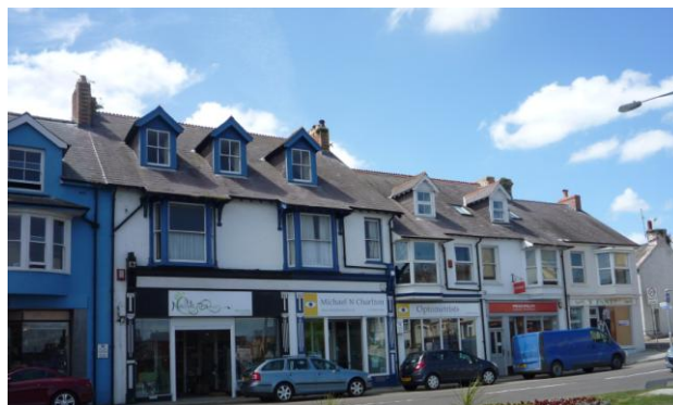
Eiddo Masnachol, Y Wesh (23.11.15)

4.4.29 Rhwng rhifau 15 a 17 West Street, wedi'i osod yn ôl o ymyl y ffordd, mae adeilad ysgol, mawr a adeiladwyd tua 1912.. Mae'n safle mawr gyda wal gerrig solet o'i gwmpas, ac o'r ffordd at y fynedfa, ac yn y ddau gyfeiriad a'r ddwy ochr tuag at Chimneys Lane ac at y modurdai tu cefn i 17 - 25 Y Wesh. Mae darn mawr o darmac ar y safle. Drwy ei ailddatblygu'n sensitif mae gan yr eiddo botensial mawr i gyfoethogi cymeriad yr Ardal Gadwraeth.