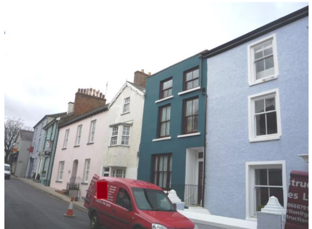
Ffenestri Fictoraidd crwm yn 1 Main Street a 3 - 11 Main Street (23.11.2015)

4.4.21 I'r ochr, mae mynedfa gul i gerbydau i Penrallt Cottage a'r Coach House isod ac i gefn rhifau 3 -13 Main Street, a hefyd at lwybrau troed sy'n cysylltu â'r Slade (gweler uchod) . Hen stablau oedd y rhain, a droswyd yn ddiweddarach yn dai, ac sy'n edrych dros ddyffryn y Slade.