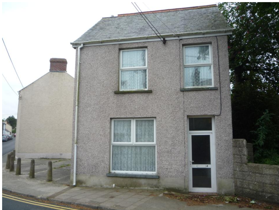
Eiddo na ddylai fod yn yr Ardal Gadwraeth (04.06.2015)

4.4.49 I'r dde o Park Street, mae ffin yr Ardal Gadwraeth yn cynnwys 9 Park Street a rhif 4 Hottipass Street. Mae'r eiddo hyn wedi cael eu moderneiddio gan golli'r manylion hanesyddol i gyd, ac am y rheswm hwn ni ddylent bellach fod o fewn yr Ardal Gadwraeth.