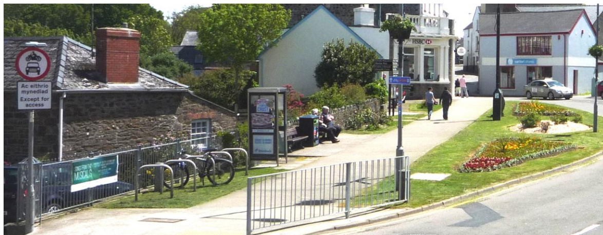
Man Agored y Wesh (04.06.2015)

gwelyau blodau yn gwella'r gofod cymunedol hwn. (Gweler llun Neuadd y Dref, Abergwaun uchod).